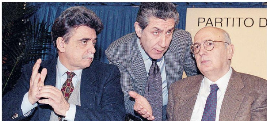
Rodotà tra Achille Occhetto e Giorgio Napolitano durante un convegno del Pds nel 1992